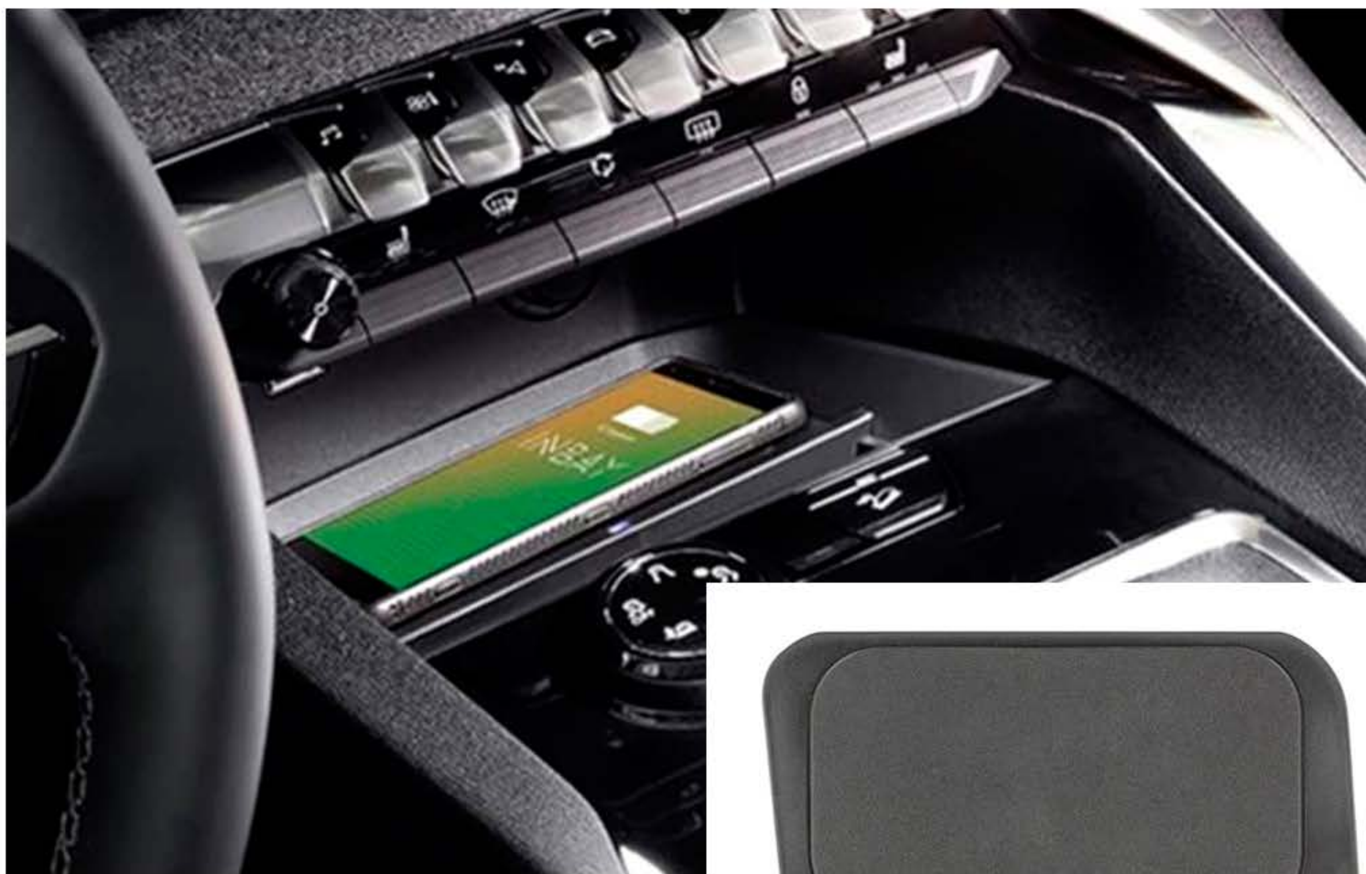
CARREGADOR 208 / 2008