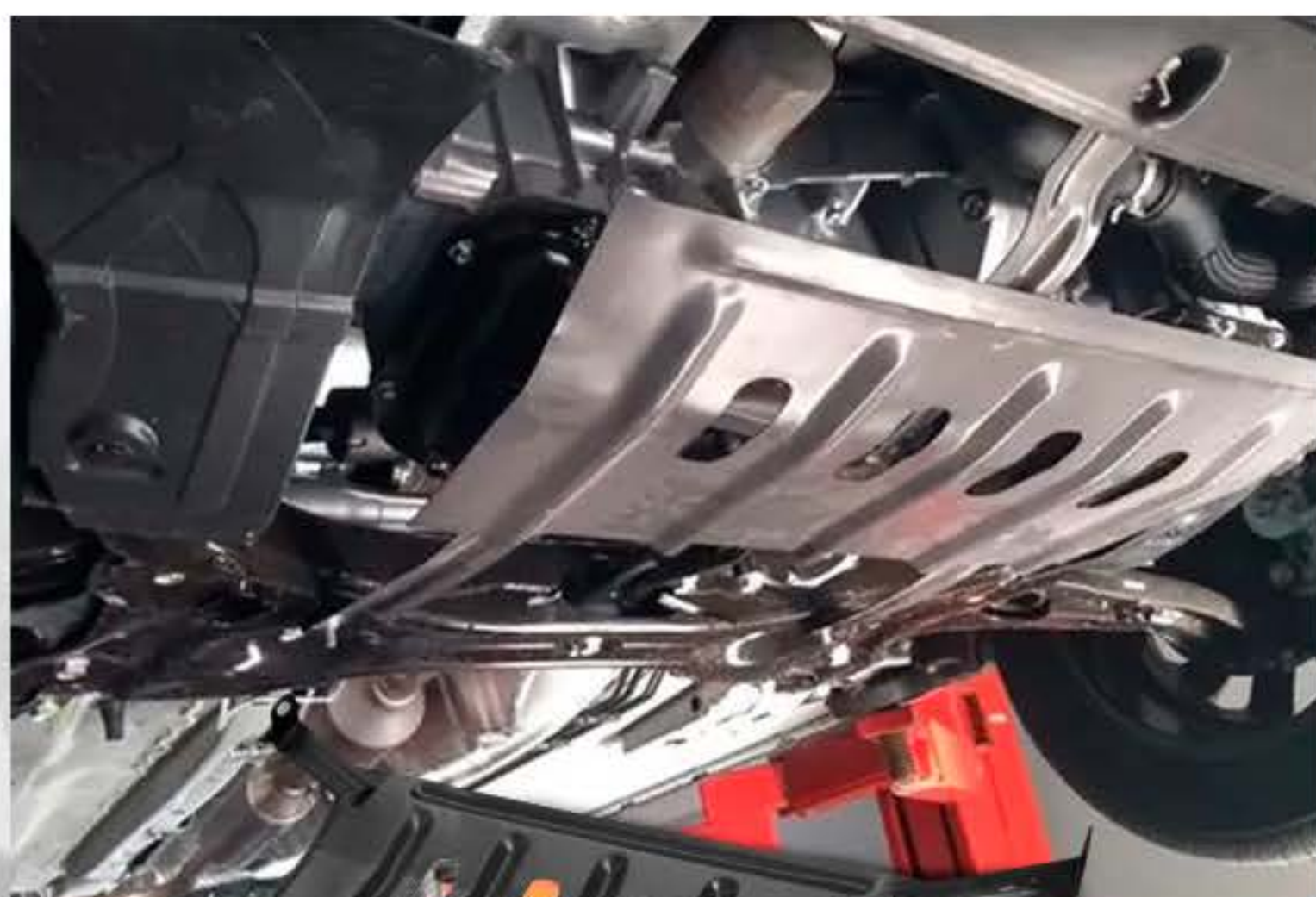
PROTETOR DE CÁRTER 208