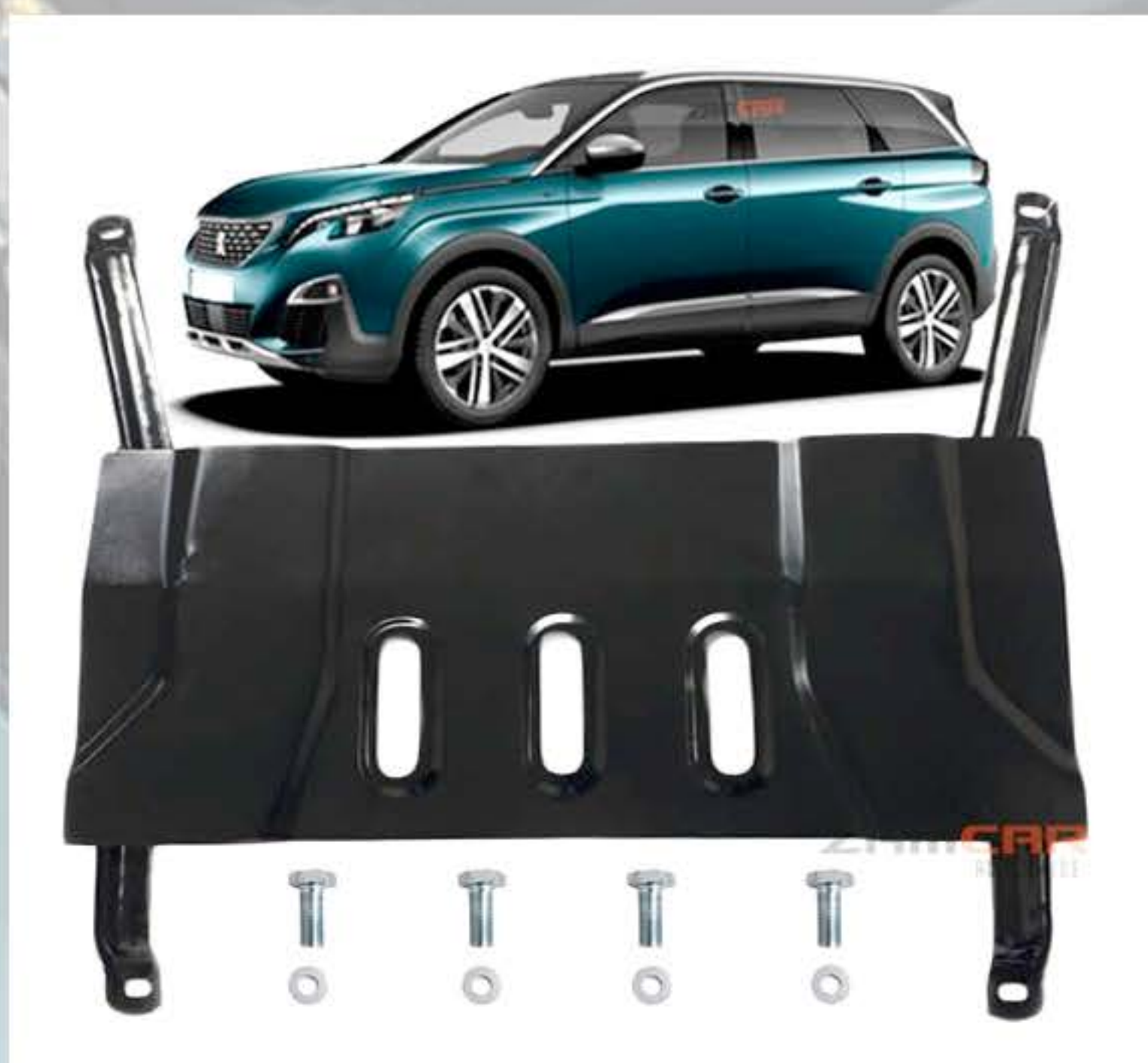
PROTETOR DE CÁRTER 3008