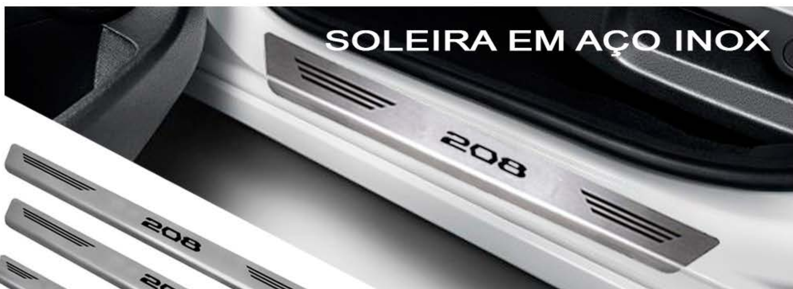
SOLEIRA EM AÇO INOX