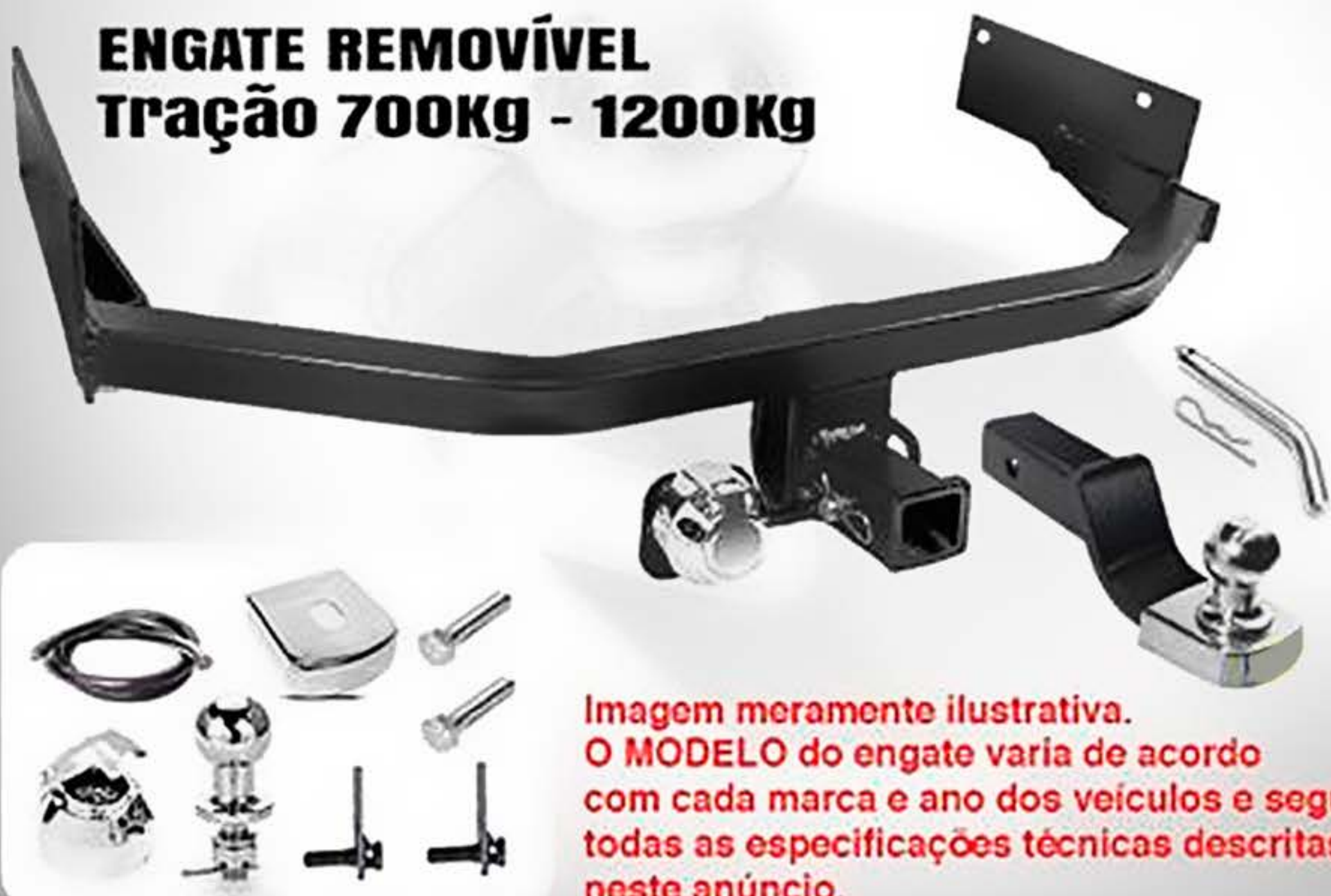
Imagem meramente ilustrativa. O MODELO do engate varia de acordo com cada marca e ano dos veículos e segue todas as especificações técnicas descritas neste anúncio.